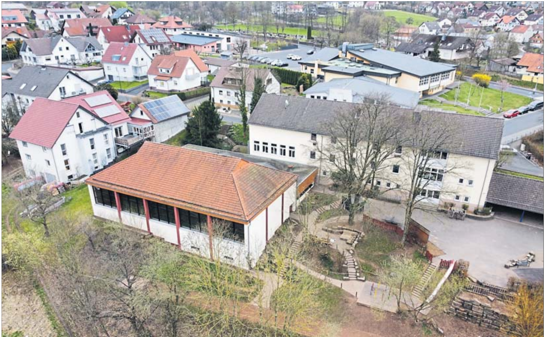
Der Blick auf die Rückseite der Poppenhausener Grundschule und die angrenzende Turnhalle.