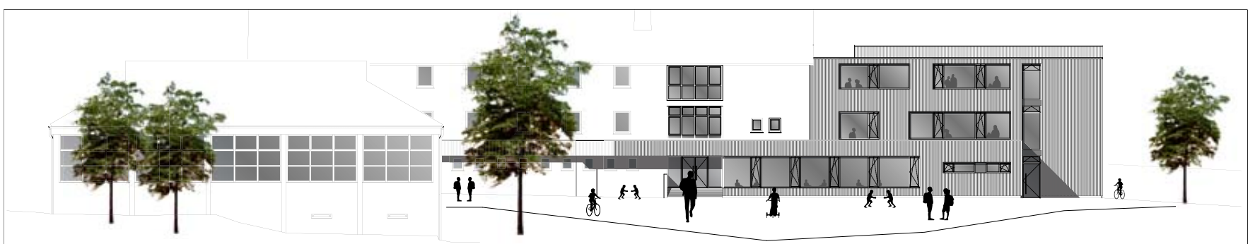
Neben dem Bestandsgebäude wird ein dreistöckiger Anbau sowie die einstöckige Mensa errichtet.